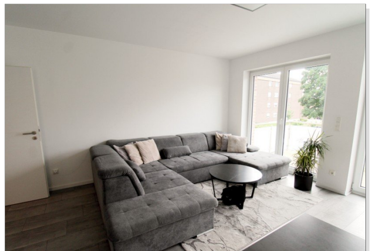
Wohnküche B 1.3