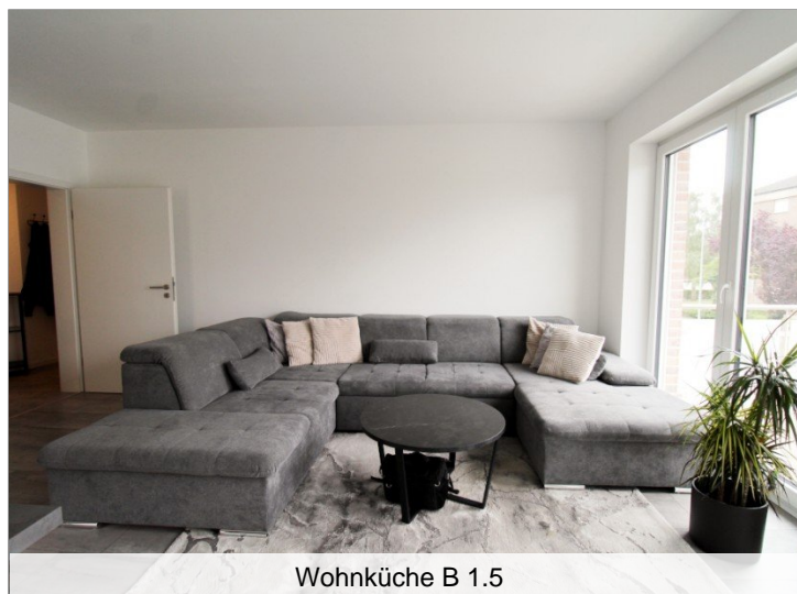
Wohnküche B 1.5