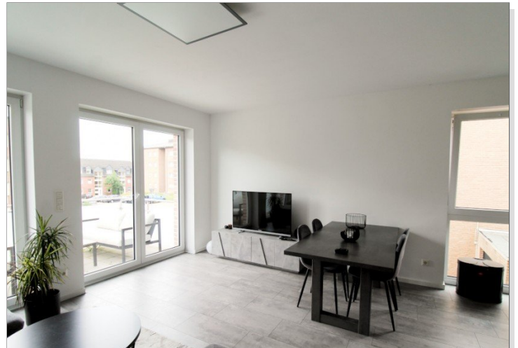
Wohnküche B 1.2