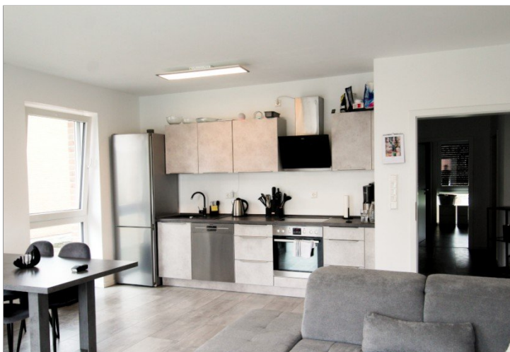
Wohnküche B 1.0