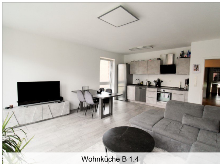
Wohnküche B 1.4