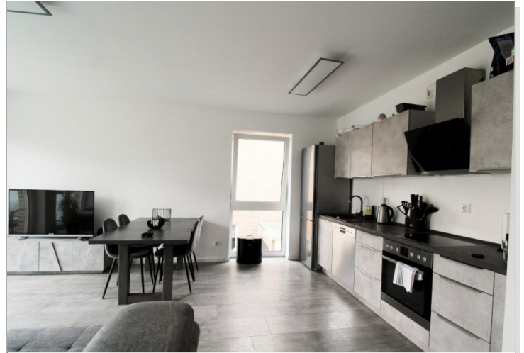
Wohnküche B 1.1