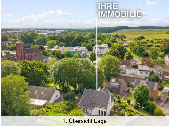
1. Übersicht Lage