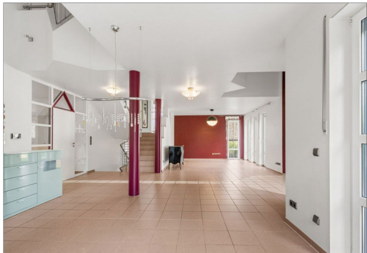
18. Wohn. Esszimmer