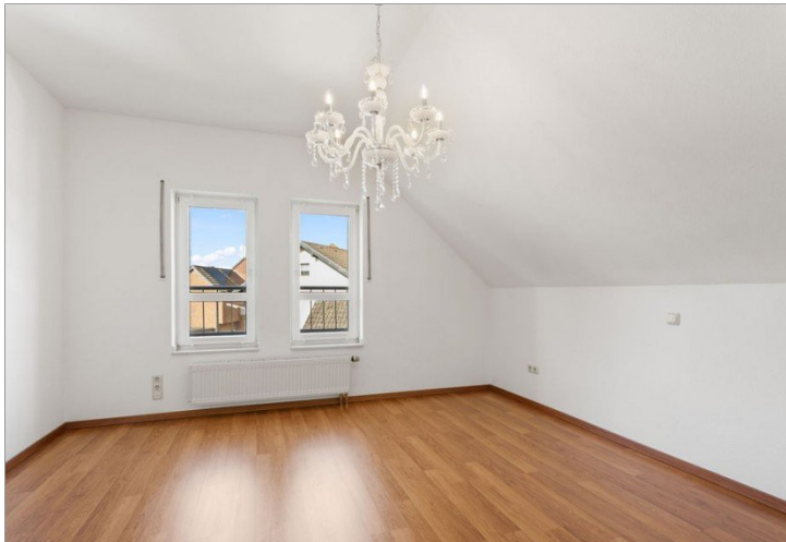
26. Zimmer OG