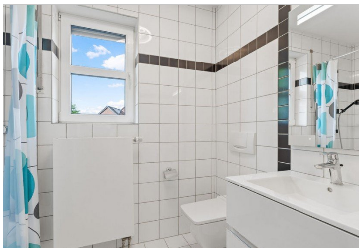
20. Gäste Duschbad EG