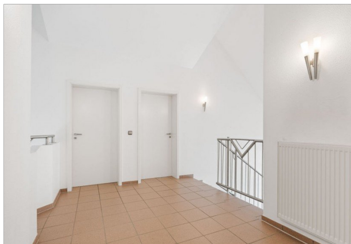
22. Diele OG