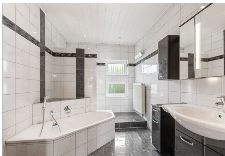
23. Badezimmer OG