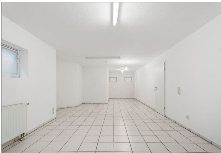
27. Zimmer KG