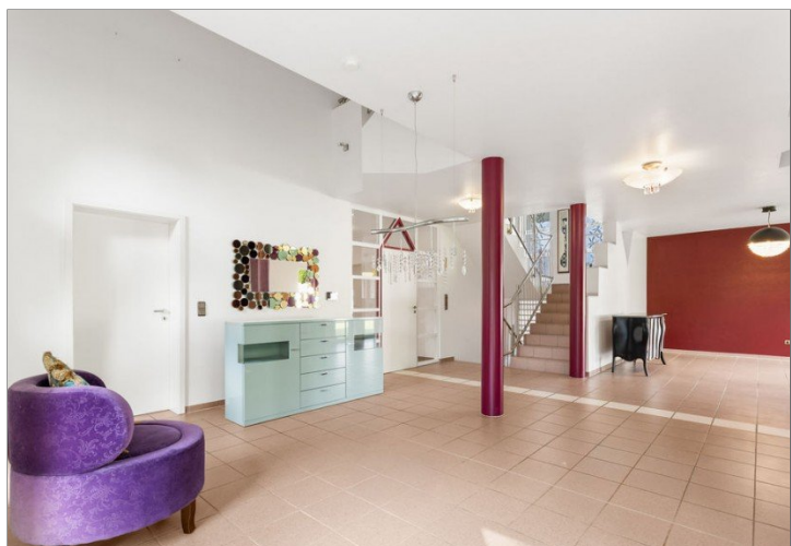
19. Wohn. Esszimmer