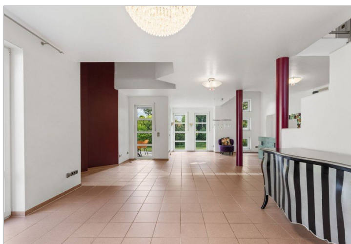
17. Wohn. Esszimmer