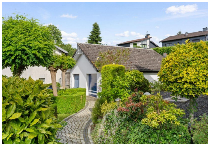
12. Weg zur Garage