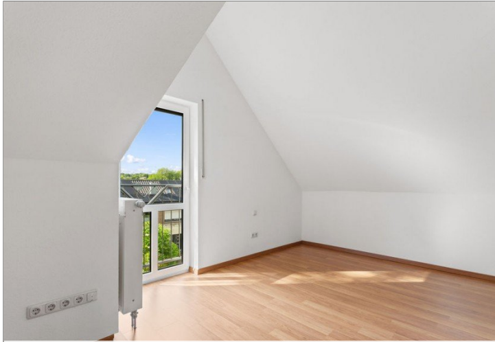
24. Zimmer OG