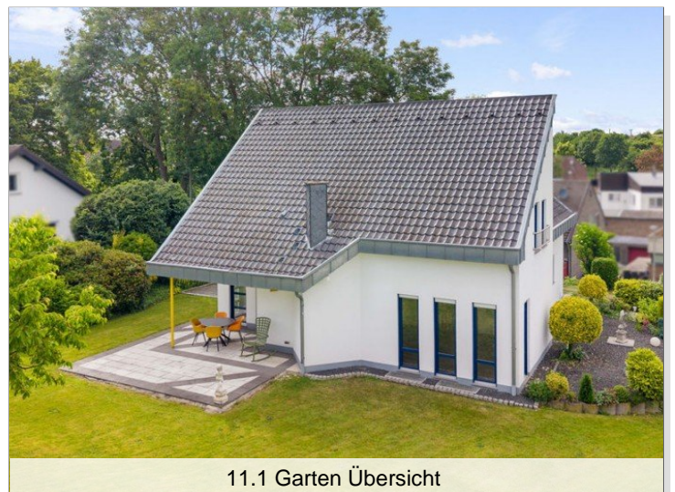
11.1 Garten Übersicht